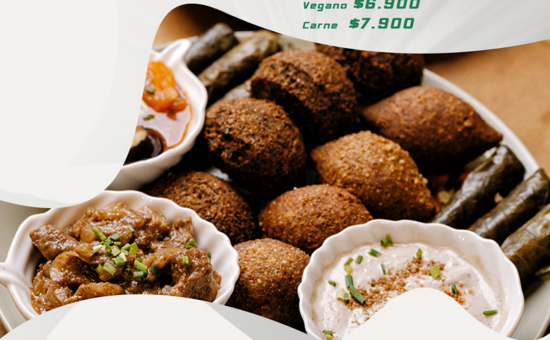
TABLA VEGGIE & CARNE

3 UNIDADES DE KUBBE CARNES 4 UNIDADES FALAFEL EGIPCIA 3 UNIDADES HOJAS DE PARRA 3 UNIDADES HOJAS DE PARRA CARNES 100GR MUSAACA 100GR KEBAB HALA CARNE 100GR BABAGHANOUSH / HUMMUS 2 PAN ARABE